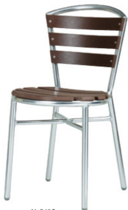
AL-P40C JAN 063590