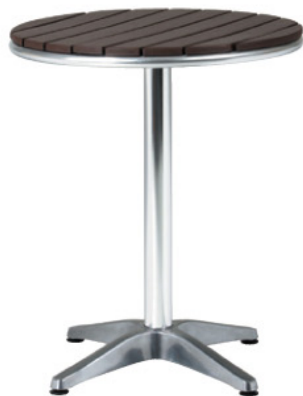
AL-P60RT JAN 063613