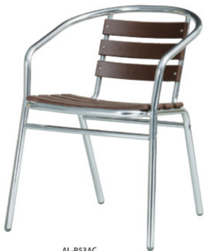
AL-P53AC JAN 063606