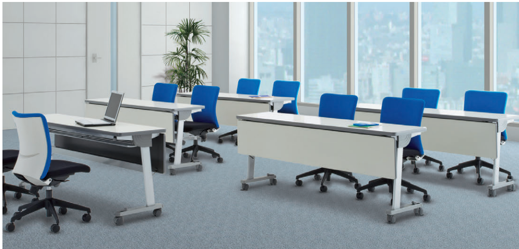
セット写真のテーブル STA-1845MS-G、チェア LN-300WF-B