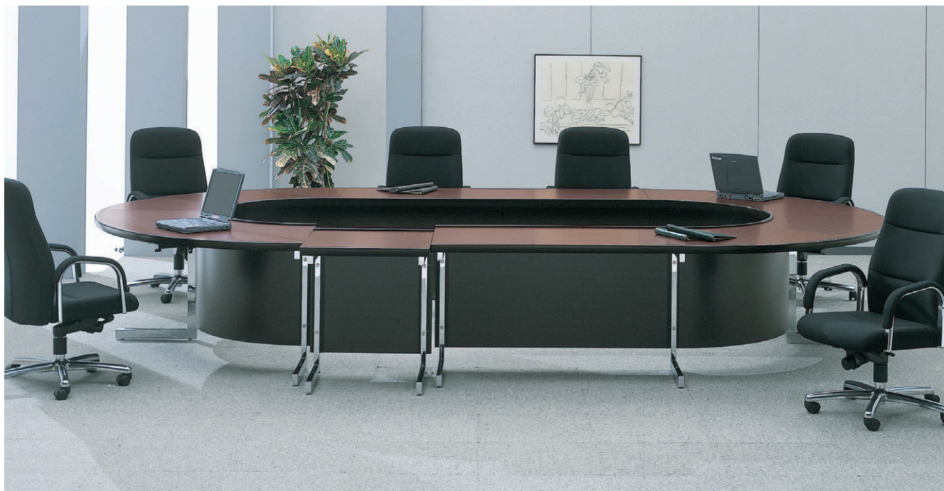
セット写真のテーブル ATR-1806R×1、ATR-1206R×1、ATR-0606CR×1、ATR-1212R×4、連結脚ATR-JFR×1