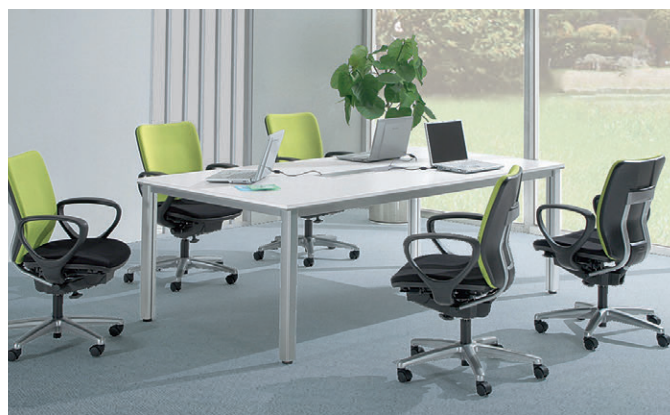
セット写真のテーブル FNM-2111TCW、チェア BC-2000F-LM+BC-100A チェア P181