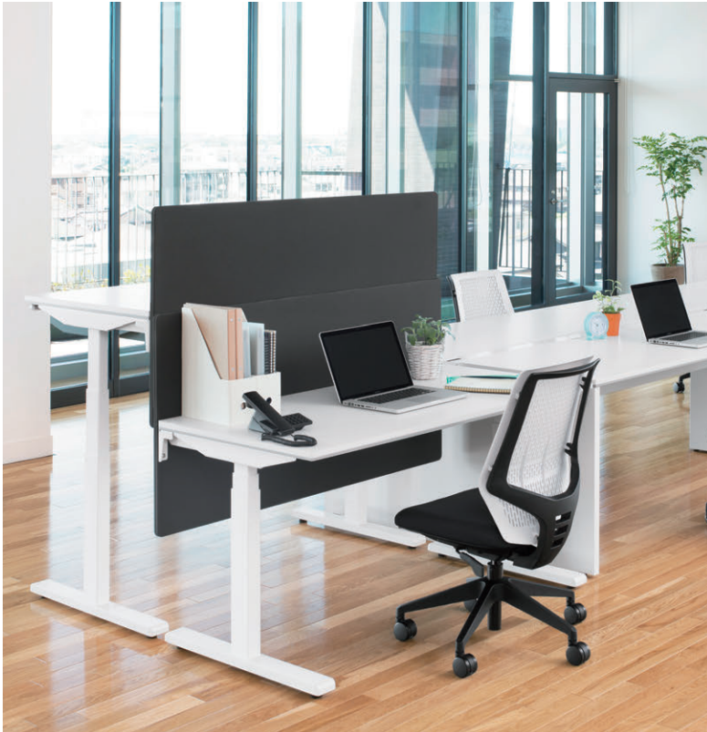
セット写真のテーブル FNL-D147HWW、チェア YC-200NW-K