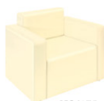
REG-01(IV) アイボリー JAN 090916