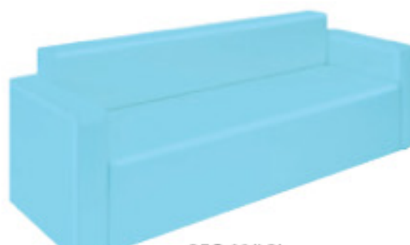
REG-03(LB) ライトブルー JAN 091265