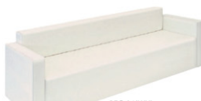
REG-04(WH) ホワイト JAN 091494