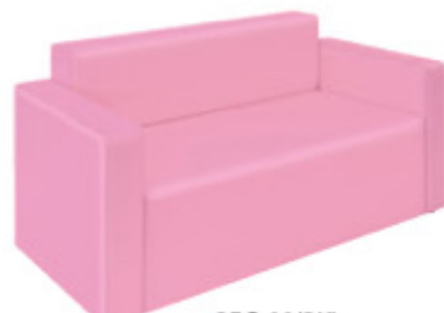
REG-02(PK) ピンク JAN 091135