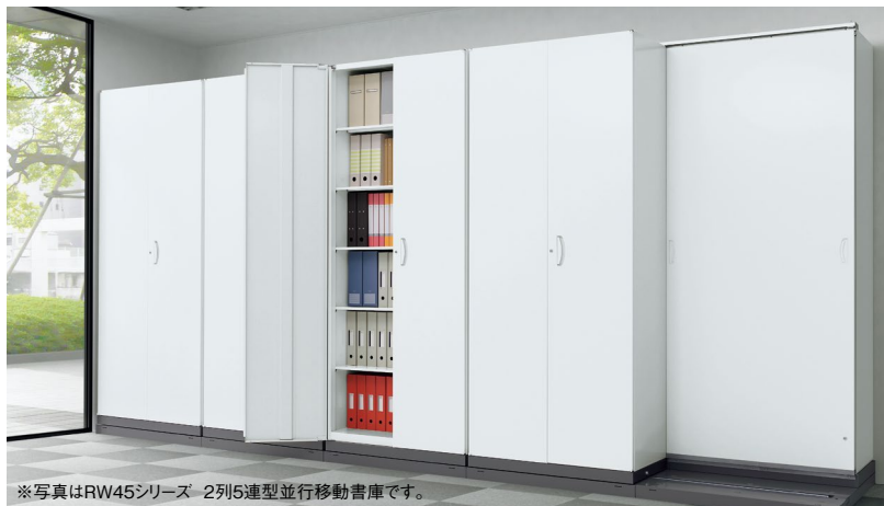
※写真はRW45シリーズ 2列5連型並行移動書庫です。

列数は前列・後列を設置する2列タイプと前列・中列・後列を設置する3列タイプがあります。収納物やスペースに応じたレイアウト構成が可能です。後列固定本体は、前列の書庫が扉がわりになりますので、オープン書庫をお使いください。(エンド部本体にフルオープンドアを取付けできます) 前列移動用本体は、両開き書庫・ラテラルキャビネット・プラスチックキャビネットなどを組合わせて使用することができます。