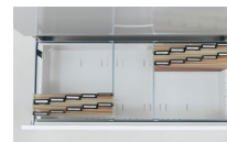
A4フォルダー縦使用例