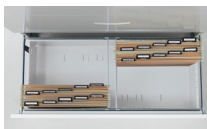
B4フォルダー縦使用例 ※ハンガーフォルダーはP.354を参照ください。