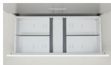
・A4ファイル縦2列収納可能 RG-TP40×2・RG-YPA4×2(オプション)