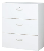
●3段ラテラルキャビネット RW4-310D RG-HP40 (標準仕切板)6枚付