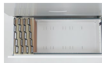
A4フォルダー横使用例