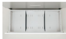
・A4ファイル横収納可能 RG-HP40×2(標準装備)