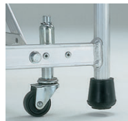
移動に便利なスプリングキャスター(φ40)付