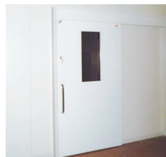
・有効開口標準寸法 W1000×H2100