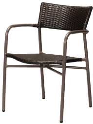
ALアルミアームチェア