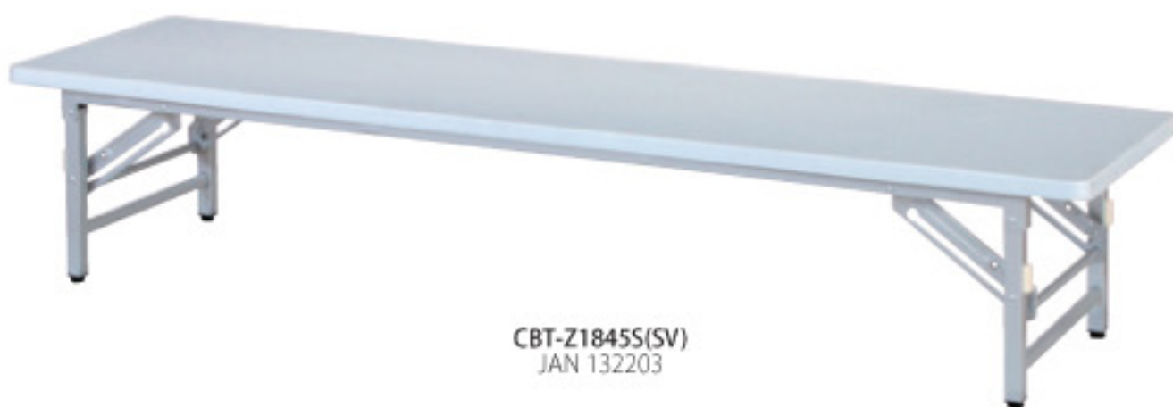
CBT-Z1845S(SV) JAN 132203