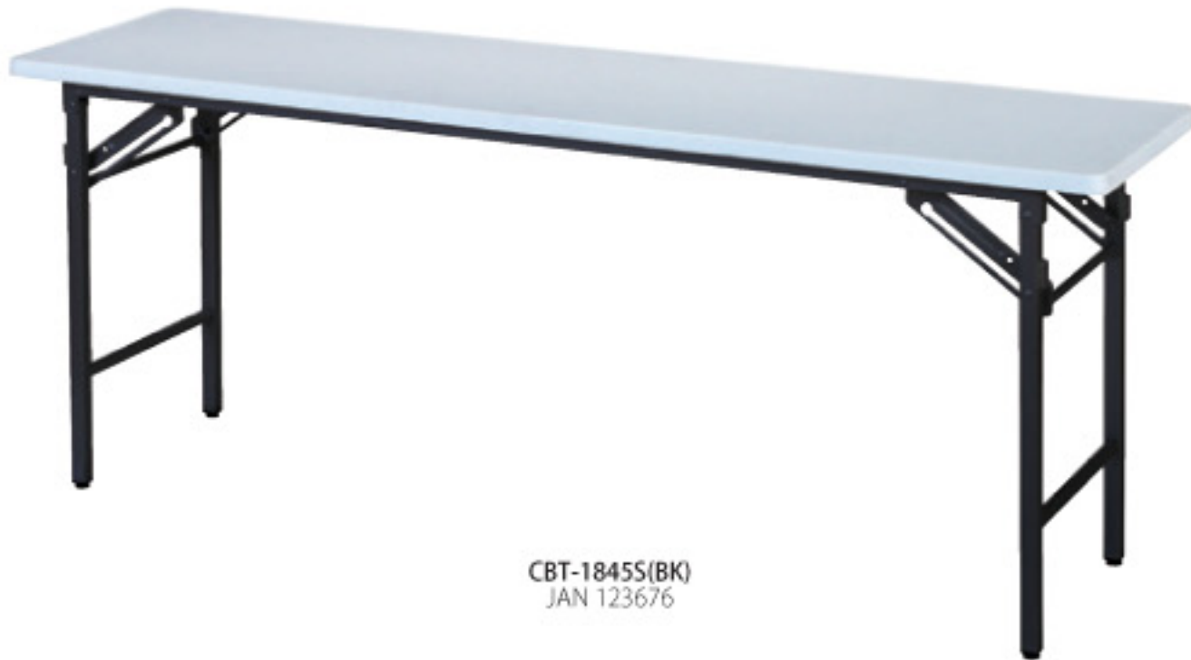
CBT-1845S(BK) JAN 123676