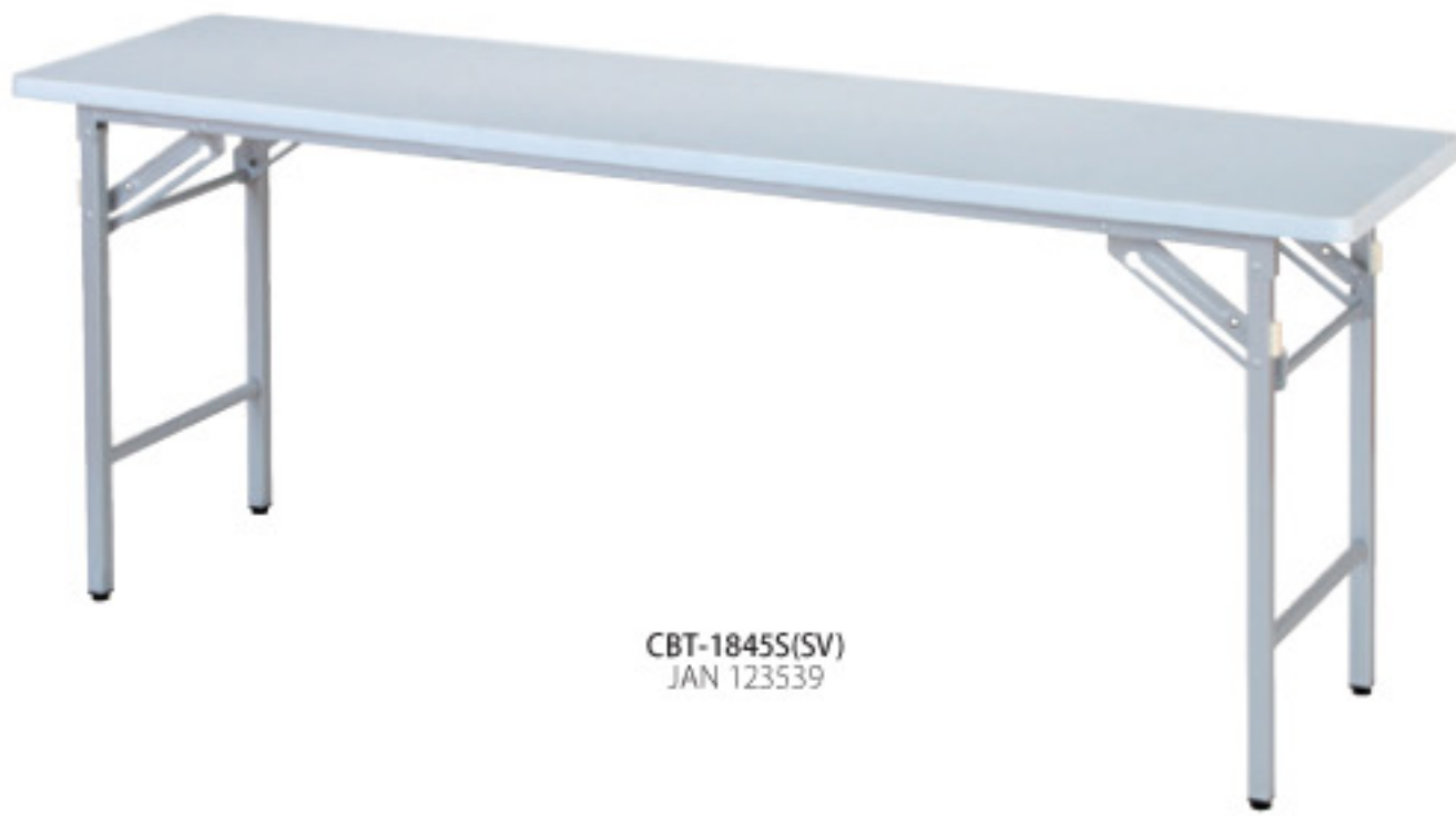
CBT-1845S(SV) JAN 123539