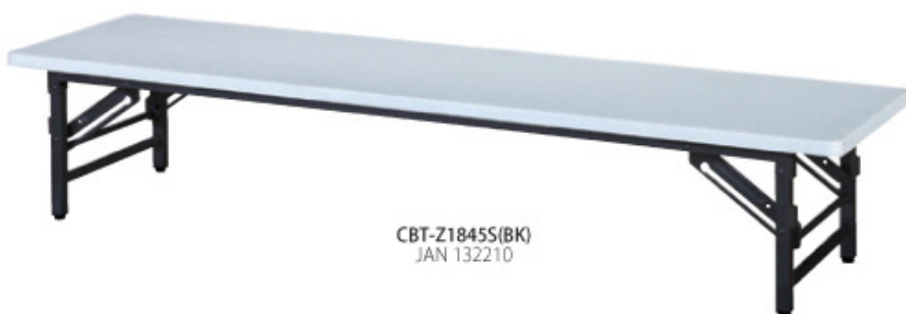
CBT-Z1845S(BK) JAN 132210