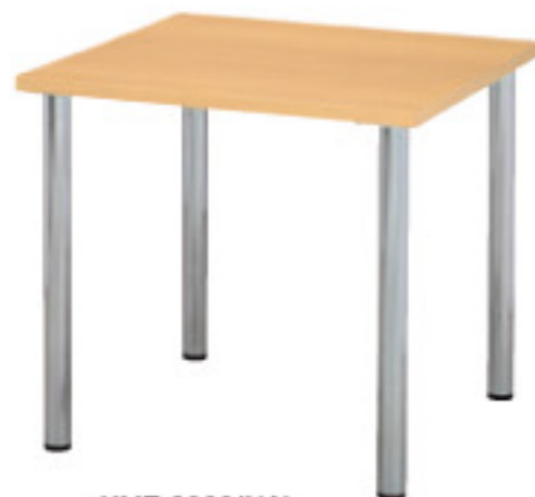
YMT-9090(NA) ナチュラル JAN 069073