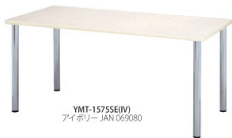
YMT-1575SE(IV) アイボリー JAN 069080