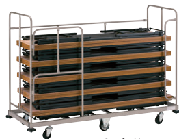
コーナーダンパー付 TDE-450D

W2030×D610×H1350(23.0kg) ●収納台数/W1800×D450、折りたたみテーブル：10台