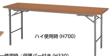
ロー使用時/保護バー付き (H330)