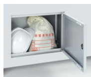
防災ボックス ※防災用品は含まれません

FNLユニットデスクに、防災ヘルメット、災害時用の水・食糧等の備蓄を収納できる防災用品収納機能を持たせました。