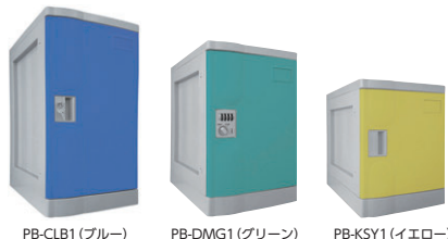
PB-CLB1 (ブルー) (ベース付) W310×D470×H638 内寸/266×417×555 PB-DMG1 (グリーン) (ベース付) W310×D471×H492 内寸/266×417×410 PB-KSY1 (イエロー) (ベース付) W310×D470×H405 内寸/266×417×322