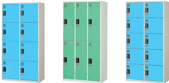
① KR-2408SLB (ライトブルー) ② KR-3206SLM(ライトグリーン) ●ハンガーパイプ、鏡板1枚付 ③ KR-2510SLB (ライトブルー)