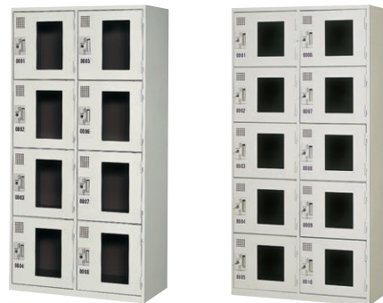
④ KR-2408ALG (ライトブルー) ⑤ KR-2510ALG (ライトブルー)