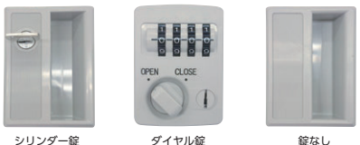
シリンダー錠 ダイヤル錠 錠なし