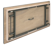
RT-1890KH折りたたみ状態 折りたたみ時95mm厚