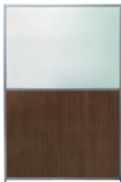
SMP-U1812(WT) ウォールナット JAN 131916