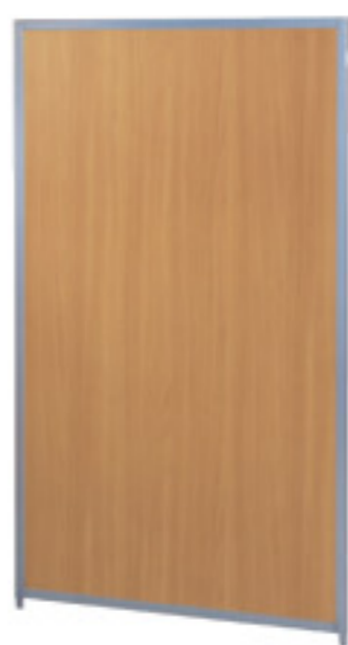
SMP-1509MP(NA) ナチュラル JAN 054475