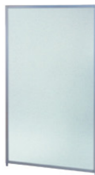
SMP-1509PC(CR) クリアフロスト JAN 054499