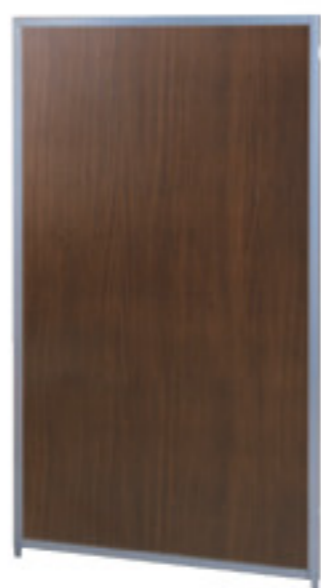
SMP-1509MP(WT) ウォールナット JAN 054482