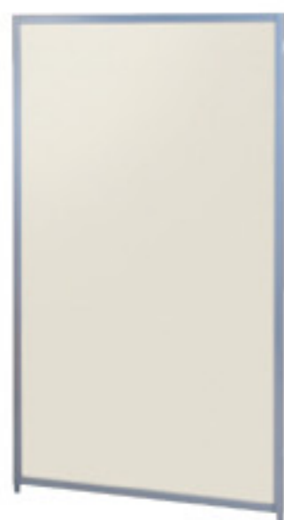
SMP-1509MP(IV) アイボリー JAN 078808