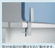
取付金具の位置は左右に動きます。