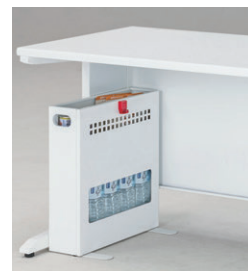
3日用縦置セット例