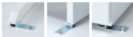
L字脚前部取付け例 L字脚後部取付け例 袖箱取付け例

スチールデスクのアジャスター部に固定金具を掛け、床にアンカーボルトで固定することで、デスクのズレ・転倒を防止します。 ※ハイアジャスターには取り付けできません。