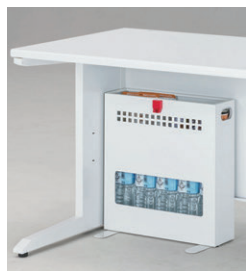
3日用横置セット例