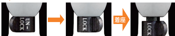
レバー位置/アンロック

キャスターをロック状態にし着座すると自動的にロックがかかり移動しにくくなります。(アンロック状態ではかかりません) キャスター/ポリウレタン双輪キャスター